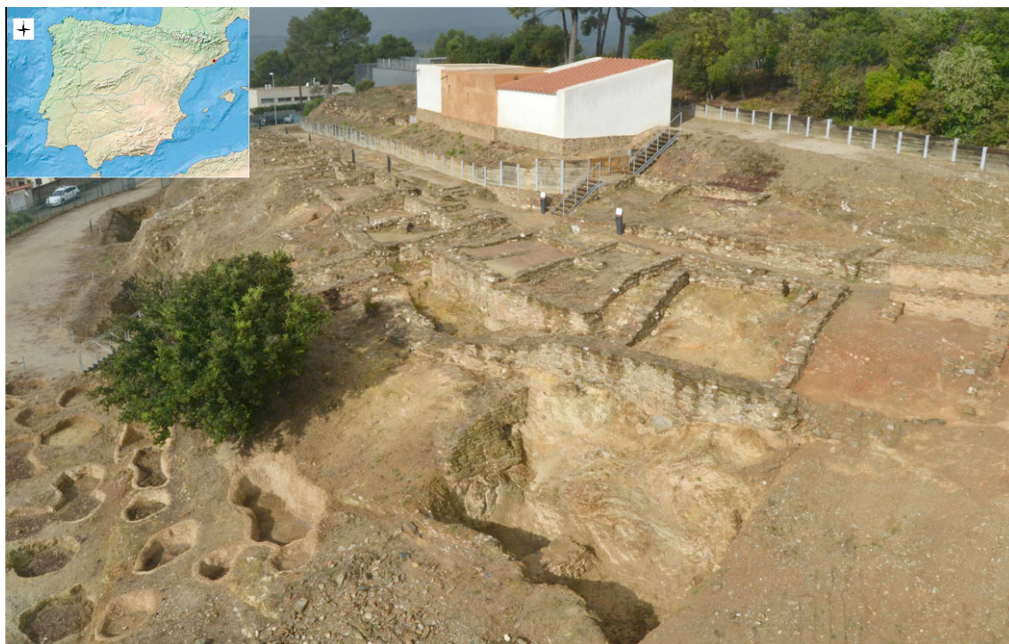
Fig. 1: Imagen general de las excavaciones de Turó de Ca n'Oliver en la que se muestra el foso FS-635, donde apareció la inscripción. Fotografía tomada desde el S.

Ca n'Oliver se consolidará durante el periodo del Ibérico Pleno (fases 2 i 3) como centro artesanal y de intercambio de mercancías. Existen claras evidencias de espacios destinados al trabajo metalúrgico y, en las últimas intervenciones, también se han localizado en el interior de los fosos defensivos, abundantes escorias cerámicas y piezas aparentemente pasadas de cocción. Se trata de evidencias indirectas de la existencia de, como mínimo, un horno de cerámica cercano del que tenemos referencias orales y fotografías antiguas, aunque todavía no se ha podido localizar. El final de este momento de expansión del poblado se produce de manera abrupta ya que Ca n'Oliver es destruido en el marco de los acontecimientos bélicos relacionados con la Segunda Guerra Púnica.