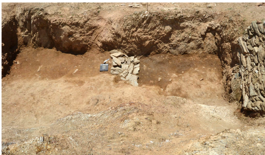
Fig. 2: Detalle del foso FS-635, donde apareció la inscripción. Fotografía tomada desde el N.