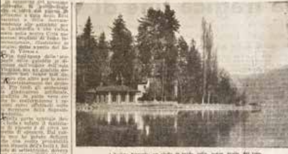
L'Isolino Virginia: un'isola in mezzo alle acque gelate del lago

La scoperta del nostro lago al centro della manifestazione internazionale che si inaugurerà domenica