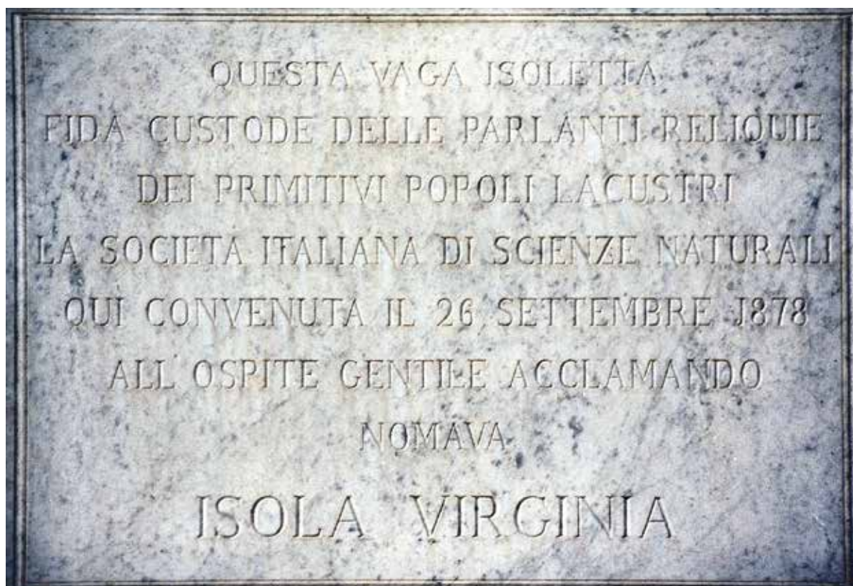
4. Lapide posta sulla Villa Ponti all'Isolino che commemora sia la visita della Società Italiana di Scienze Naturali il 26 settembre 1878 che il nuovo nome dato all'Isola